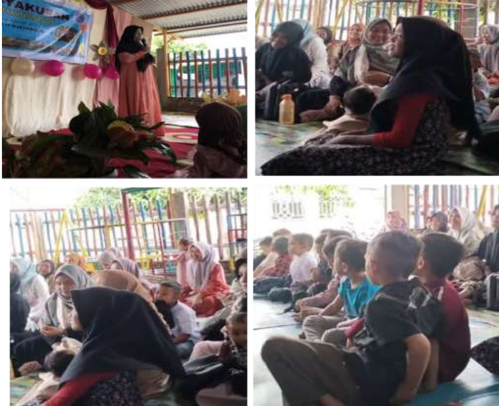
Gambar 3. Rangkaian kegiatan dalam program pengabdian masyarakat di PAUD Bustanul Ma'arif

Partisipasi ini mencakup berbagai aspek, antara lain keterlibatan dalam persiapan kegiatan anak, kehadiran aktif dalam pertemuan kelas, serta komunikasi yang lebih intens dengan guru mengenai perkembangan akademik dan sosial anak. Peningkatan partisipasi ini tidak hanya berdampak pada aspek kuantitatif, tetapi juga pada kualitas hubungan antara guru dan orang tua. Hubungan emosional yang terjalin menjadi lebih positif, di mana orang tua dan guru memandang diri mereka sebagai mitra sejajar dalam proses pendidikan, bukan sekadar pelaksana tugas masing-masing. Kondisi ini mencerminkan terciptanya kemitraan yang efektif antara keluarga dan sekolah, yang secara langsung mendukung pengembangan anak secara holistik.