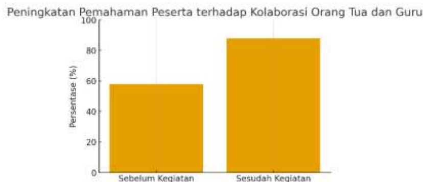
Gambar 2. Peningkatan Pemahaman Peserta terhadap Kolaborasi Orang Tua dan Guru

Gambar ini menunjukkan lonjakan dari 58% pada kondisi awal menjadi 88% setelah kegiatan, menandakan keberhasilan program dalam meningkatkan kesadaran dan kemampuan kolaboratif peserta. Dengan demikian, kegiatan ini tidak hanya memberikan pengetahuan baru, tetapi juga membentuk kesadaran kolektif di antara orang tua dan guru bahwa keberhasilan pendidikan anak bergantung pada sinergi yang erat antara lingkungan sekolah dan rumah. Peningkatan pemahaman ini menjadi fondasi penting bagi keberlanjutan program kolaborasi yang dapat diterapkan secara berkesinambungan di PAUD Bustanul Ma'arif maupun lembaga pendidikan anak usia dini lainnya.