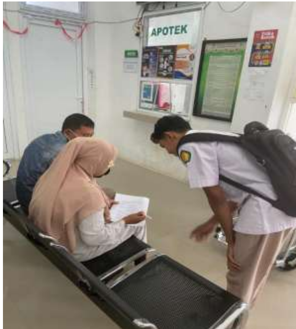
Gambar 2. Proses pendampingan pengisian kuesioner oleh tim pelaksana kepada responden di Puskesmas Baitussalam sebagai bagian dari kegiatan evaluasi kepuasan pelayanan informasi obat.