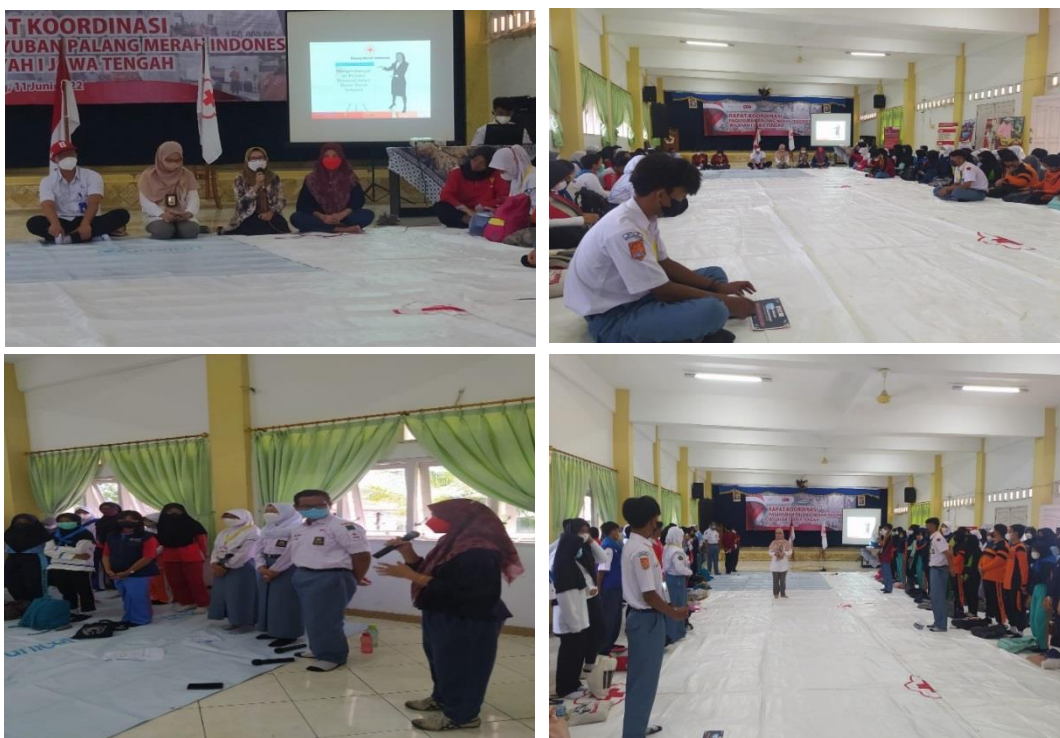
Gambar 2. Pemaparan Materi

Secara umum, hasil dari kegiatan pengabdian pelaksanaan kegiatan penyuluhan kesehatan reproduksi telah sesuai target. Peningkatan pemahaman siswa/siswi dapat dilihat dengan antusiasme dalam memperhatikan setiap materi yang disampaikan serta banyaknya pertanyaan yang diajukan siswa/siswi baik mengenai hal-hal dalam proses perubahan fisik yang terjadi maupun dalam kesehatan reproduksi remaja dan bagaimana cara penanganannya dengan benar. Disetiap akhir sesi pemateri mengajukan pertanyaan-pertanyaan kepada siswa/siswi secara lisan tentang materi yang telah diberikan dan mayoritas siswa/siswi dapat menjawab pertanyaan tersebut. Evaluasi kegiatan juga dilakukan dengan memperhatikan berbagai tanggapan dan masukan dari peserta selama kegiatan berlangsung. Selain itu, evaluasi juga dimaksudkan untuk perbaikan pelaksanaan kegiatan sosialisasi di masa mendatang sehingga output kegiatan akan lebih baik.