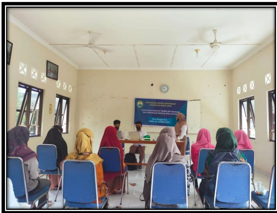
Gambar 1. Proses Pelaksanaan Pengabdian

Dokumentasi kegiatan merupakan gambaran proses pengabdian yang dilaksanakan oleh tim kepada para anggota Karang Taruna Desa Mangga Dua