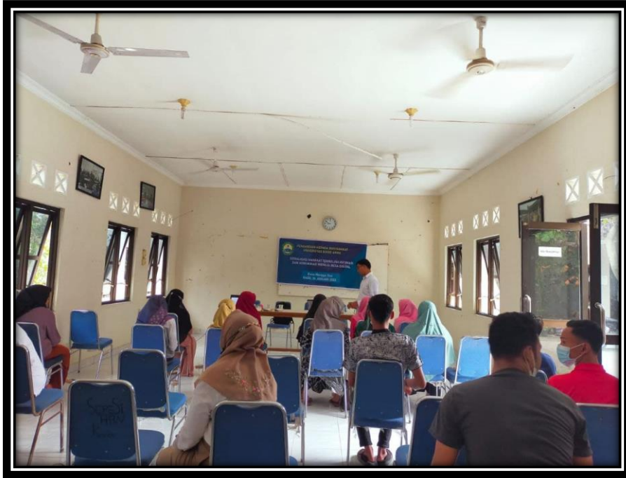
Gambar 2. Proses Pelaksanaan Pengabdian