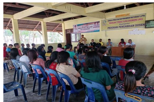
Gambar 1. Dokumentasi kegiatan pengabdian Dosen di desa Bawonohono, Kec. Fanayama Nias Selatan